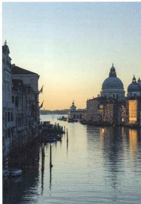
L'hôtel Aman est hébergé dans le Palazzo Papadopoli, sur le Grand Canal.