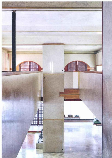
Negoziò Olivetti, conçu par Carlo Scarpa en 1957, sous les arcades de la place Saint-Marc.