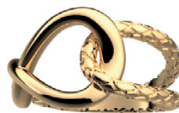
LES GEORGETTES Bague « Icône Infini », laiton doré.