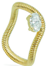
LEANDRA STUDIO Bague collection « Cabo », or jaune 18 carats, diamant.