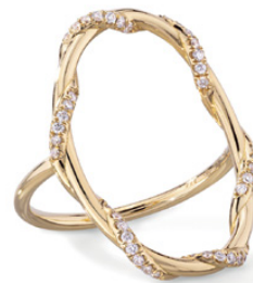
MANSANO Bague « Talya Grande Sertie », or jaune 18 carats recyclé, diamants.