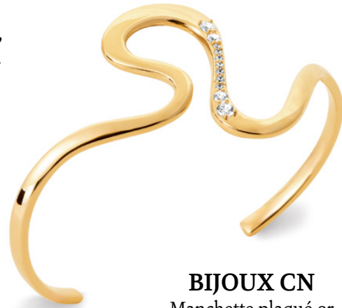
BIJOUX CN Manchette plaqué or 750 millièmes, zirconias.