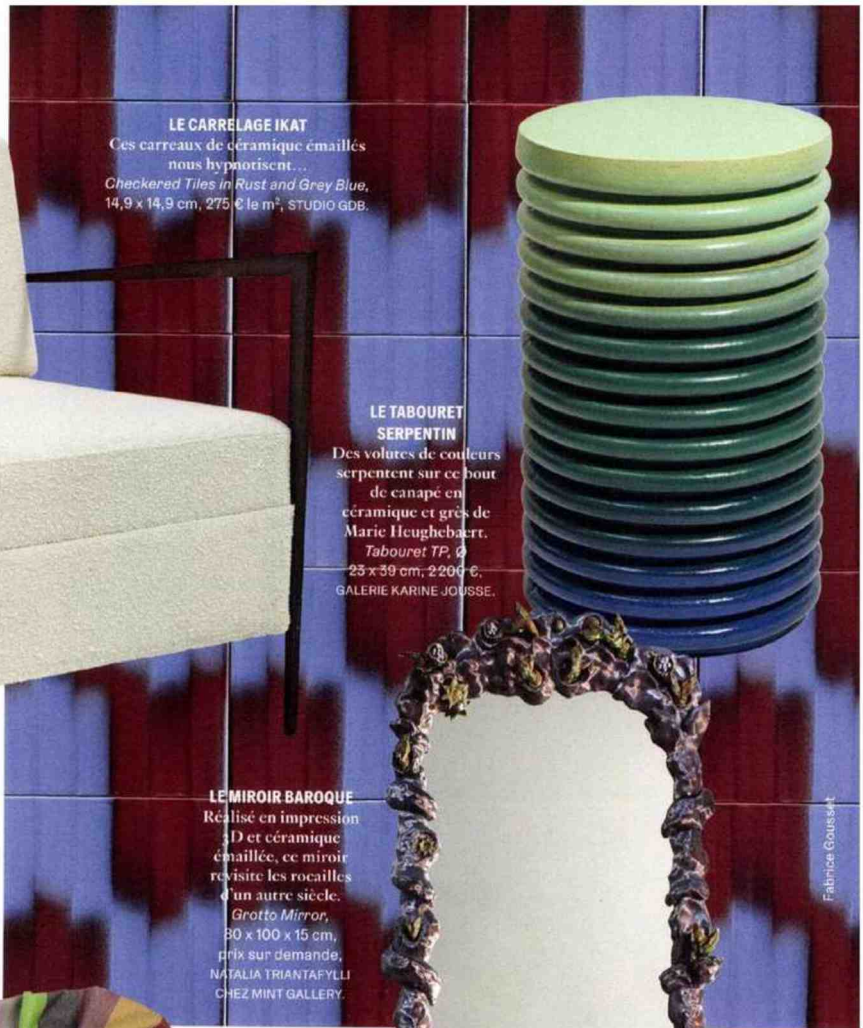
LE CARRELAGE IKAT Ces carreaux de céramique émaillés nous hypnotisent... Checkered Tiles in Rust and Grey Blue , 14,9 x 14,9 cm, 275 €/m 2 , STUDIO GDB.