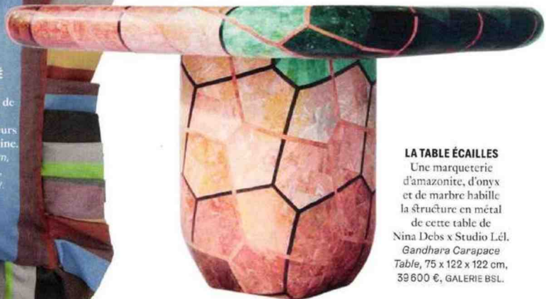
LA TABLE ÉCAILLES Une marqueterie d'amazonite, d'onyx et de marbre habille la structure en métal de cette table de Nina Debs x Studio Lél. Gandhara Carapace Table , 75 x 122 x 122 cm, 39600 €, GALERIE BSL.