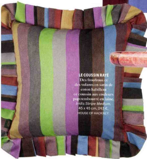
LE COUSSIN RAYÉ Des froufrous et des volants en satin de coton habillent ce coussin aux couleurs pop rembourré en laine. Iridis Stripe Medium , 45 x 45 cm, 243 €, HOUSE OF HACKNEY.