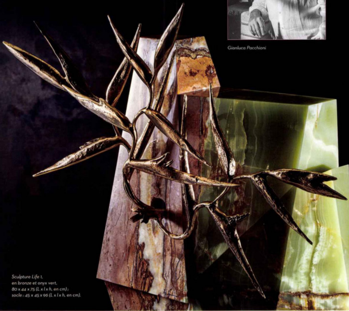
Sculpture Life 1, en bronze et onyx vert, 80 x 44 x 75 (L x l x h, en cm); socle : 45 x 45 x 96 (L x l x h, en cm).