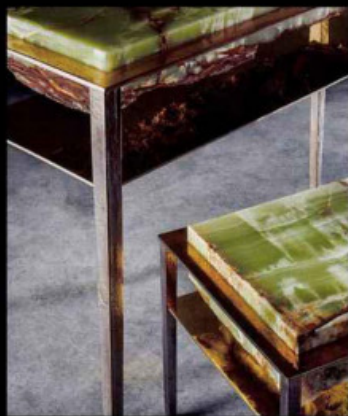
Console et guéridon Cremino, en bronze, laiton et onyx, 87 x 32 x 85 et 37 x 37 x 44 (L x l x h, en cm).