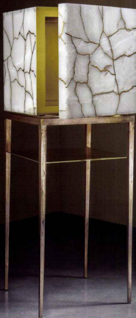
Metaphysical Cube, meuble haut en bronze coulé, bronze liquide, laiton poli et onyx blanc, 60 x 60 x 160 (L x l x h, en cm).