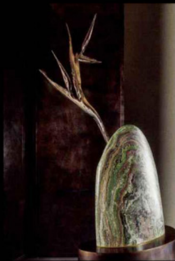
Sculpture Eden, en bronze, laiton et onyx émeraude 80 x 25 x 170; base 100 x 40 x 60 (L x l x h, en cm).