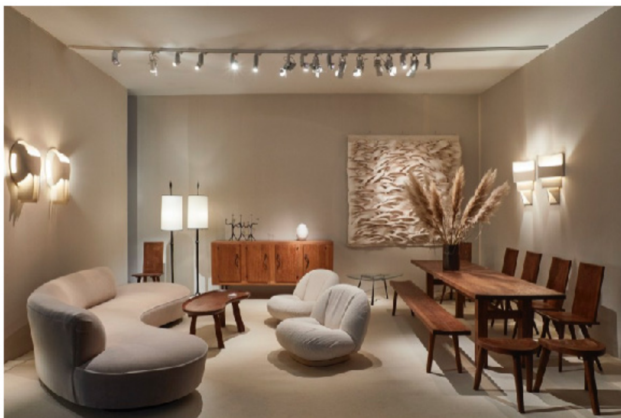
IMAGEM © Cortesia PAD © Galerie Gosserez © Carpenters Workshop Gallery © Maison Jaune Studio © Galerie Armel Soyer © Galerie Downtown © Galerie BSL © Galerie Maria Wettergren © Galerie Alexandre Guillemain © Galerie Yves et Victor Gastou

Pour visualiser l'article en ligne, cliquez ici .