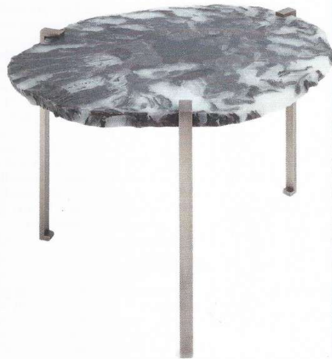
Paire de guéridons Gemme. Design Hervé Langlais. Verre « Build in Glass » et bronze. L 55 cm x l 45 cm x h 44 cm. Pièce unique. Prix sur demande.