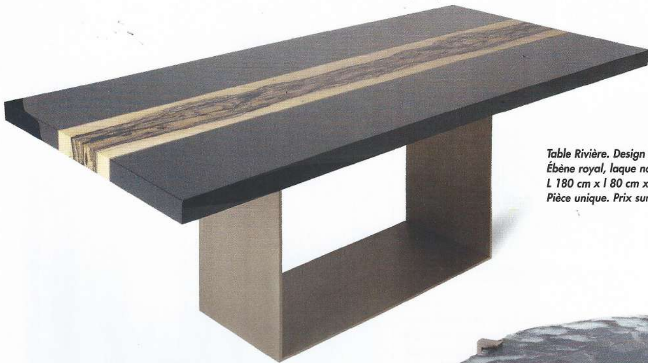
Table Rivière. Design Hervé Langlais. Ébène royal, laque noir encre et bronze. L 180 cm x l 80 cm x h 75 cm. Pièce unique. Prix sur demande.