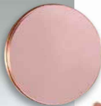
Runde Sache Spiegel »Miroir La vie en rose« von Galerie Negropontes. www.negropontes-galerie.com

Rosé-, Grau-, Beige- und Metalltöne üben vornehme Zurückhaltung und lassen sich perfekt mit gleichmäßigen grafischen Mustern kombinieren.