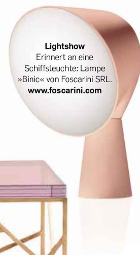
Lightshow Erinnert an eine Schiffsleuchte: Lampe »Binic« von Foscarini SRL. www.foscarini.com