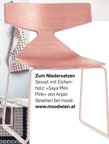
Zum Niedersetzen Sessel mit Eichenholz: »Saya Mini Pink« von Arper. Gesehen bei mood. www.moodwien.at