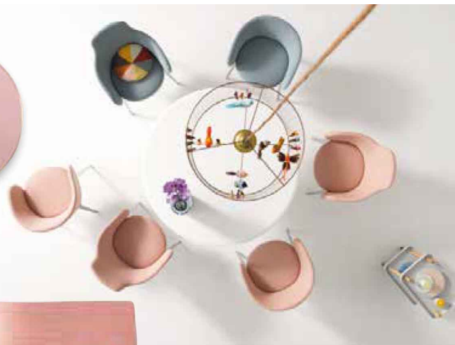
In bester Gesellschaft Polsterstühle »Roc« und Tisch »Conic«, alles von COR. www.cor.de