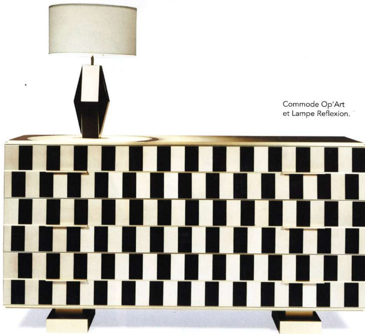
Commode Op'Art et Lampe Reflexion.