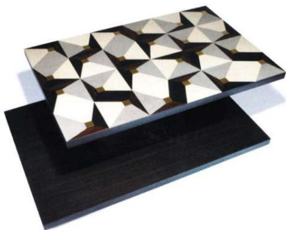
Table basse Gio.