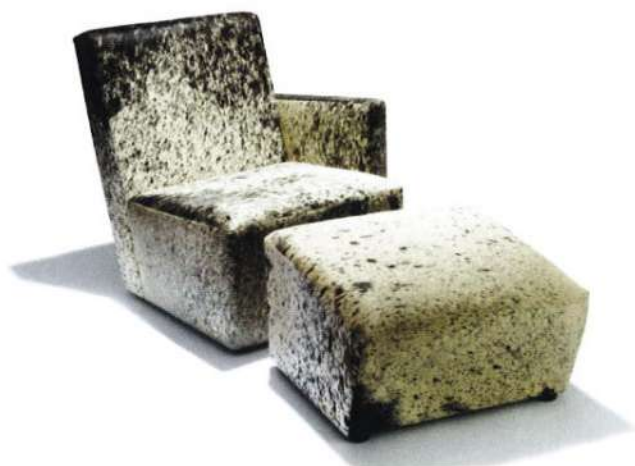
Fauteuil et pouf Petit Franck.