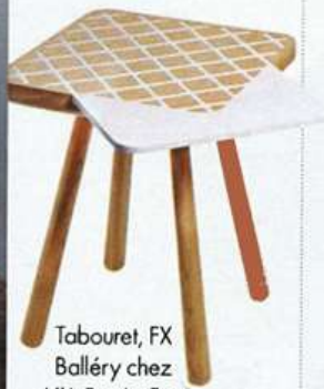
Tabouret, FX Balléry chez Y'A Pas Le Feu Au Lac.