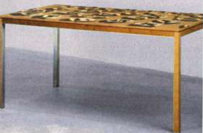
Table, Agnès Thumauer, chez LN Édition.