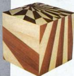
Cube de rangement Tectonic Silence Cube, Rue Monsieur Paris.

Ces assemblages de bois précieux ont longtemps fait la réputation de l'ébénisterie à la française, mais le XX e siècle, le modernisme, les meubles en kit et l'influence pop ont mis en sommeil la marqueterie. Aujourd'hui, cette belle au bois dormant se réveille grâce à de charmants designers... La nouveauté ? Des motifs géométriques, plutôt que naturalistes, et des pièces rehaussées, positionnées à mi-chemin entre le mobilier et les œuvres d'art. C'est le cas chez Ymer & Malta, où les créations inouïes flirtent avec la haute couture ! Une option sylvestre glam à savourer sans modération. D.G.