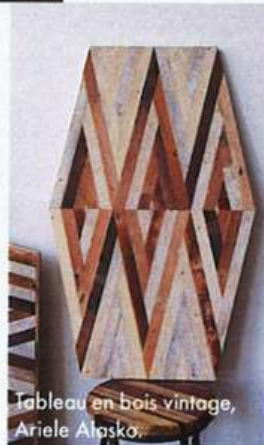
Tableau en bois vintage, Ariele Alaska.