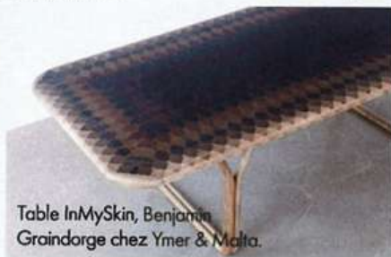
Table InMySkin, Benjamin Graindorge chez Ymer & Malta.