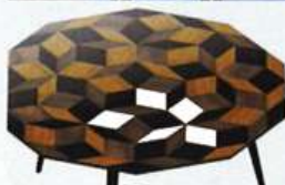
Table Penrose Giant, Ich & Kar chez Bazartherapy.