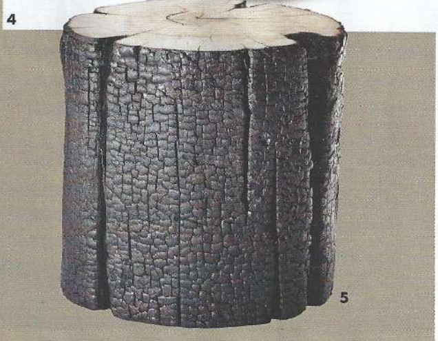
3. Curiosité brûlante Coffre "Dragon", en liteaux de bois brûlés et de bronze, design Hervé Langlais, issu de la collection "Matières révélées", pièce unique (Curiosités d'Esthètes). 4. Volcanique Bol "30 ans", en aune carbonisée et pigment, du sculpteur Jérôme Blanc. 5. Coup d'Hekla Signé Thomas Bastide, ce bout de canapé "Hekla" brut en bois brûlé résiné (Bleu Nature).

Tandis que Jérôme Blanc s'inspire du raku (procédé de cuisson de la céramique), Hervé Langlais sélectionne des liteaux brûlés à la main par l'entreprise Lallier. « Pour la collection "Matières révélées", à la galerie Curiosités d'Esthètes, je souhaitais mettre en avant des matériaux inédits. La texture de ces liteaux, craquelée naturellement, m'a emballé », explique ce dernier.