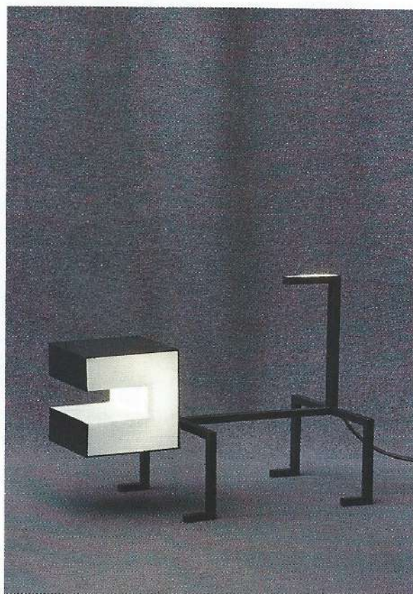
Patrick Hourcade, Canis , 2013, métal patiné, verre antique, cristal « albâtre » soufflé, 29 x 39 x 20 cm (©THIERRY MALTYP/GALERIE DU PASSAGE, PARIS).

« ELIZABETH GAROUSTE, UN MONDE ONIRIQUE », galerie Avant-Scène, 4, place de l'Odéon, 75006 Paris, 01 46 33 12 40, du 28 mars au 27 avril. + d'infos : bit.ly/7141onirique