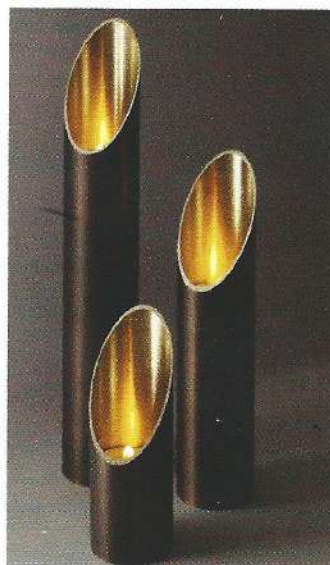
Hervé Langlais, photophores Lux , 2012, bronze, laiton brossé, Ø 4,5 cm, H. 14, 22 et 30 cm — (©FRANCK DELONCLE/GALERIE CURIOSITÉS D'ESTHÈTES, PARIS).

GALERIE CURIOSITÉS D'ESTHÈTES, 60, rue de Verneuil, 75007 Paris, 09 54 30 05 50, www.curiositesdesthetes.com