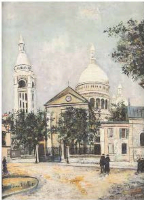
Maurice Utrillo, Place du Tertre et le Sacré-Cœur , huile sur toile, 81 x 60 cm. Estimé 60 000 à 80 000 euros.