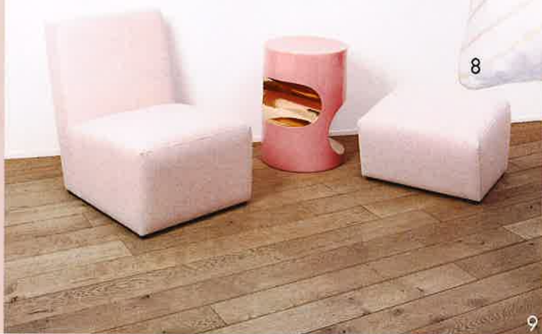
1. Tissue, "Sphere", Sahco . 2. Parure de lit, "Brisa", coloris Blush Pink, Made.com . 3. Suspension, "Cora", design Benny Frandsen, Frandsen Lighting A/S chez Sodezign . 4. Carreaux grès cérame, "Futura T Rose et Drop Rose", Carrément Victoire . 5. Vases, "Pitty", "Medy", "Gandy", Bouchara . 6. Chaise, "Rosalie", design Julien Phedyaeff, Hartô . 7. Peinture, "Peignoir", Farrow & Ball . 8. Coussin, "Auguste", D. Porthault . 9. Miroir, "La vie en rose", coll. Matières révélées, design Hervé Langlais, Galerie Negropontes .