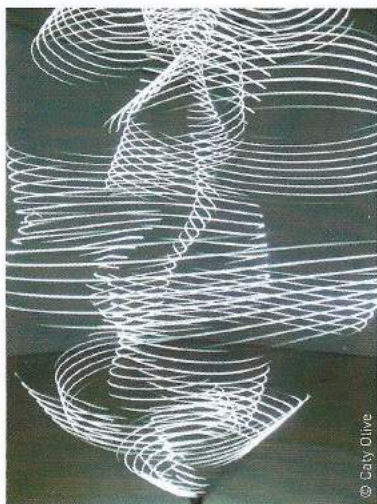
« Études de Fluides », Caty Olive, 2012.

Formée à l'École nationale supérieure des arts décoratifs de Paris (ENSAD), Caty Olive crée des scénographies lumineuses au sein de projets d'architecture, d'installations plastiques et de spectacles chorégraphiques. Elle s'intéresse tout particulièrement aux mouvements de glissement et de vibration de la lumière. Profitant des caractéristiques de l'espace de la galerie