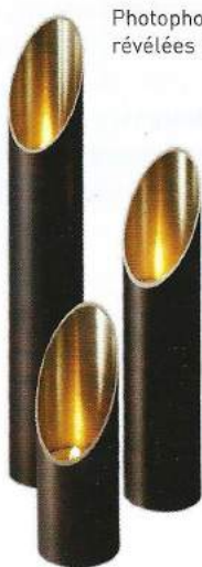
Photophore orgue 2012, collection « Matières révélées » du designer Hervé Langlais.

La galerie Curiosités d'Esthètes a pour but de renouer avec les arts décoratifs à la française en mariant avec talent art, design et savoir-faire innovants afin de présenter des créations exceptionnelles réalisées par des artisans aux savoir-faire inégalés. Une manière de retrouver l'approche luxueuse des maîtres des années 30 et 40 dans la veine de Jean-Michel Frank ou Jacques Quinet. Preuve en est, l'exposition « Matières révélées », qui dévoile la première collection de mobilier signée Hervé Langlais, des pièces exclusives qui traduisent sa double expérience d'architecte et de designer. À partir de janvier 2013 à la galerie Curiosités d'Esthètes, 60 rue de Verneuil (côté Musée d'Orsay), 75007 Paris.