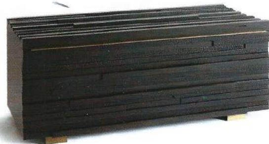
Coffre variation 2012, collection « Matières révélées » du designer Hervé Langlais.