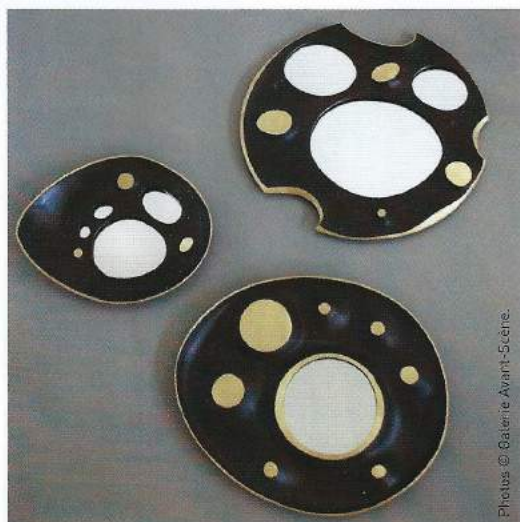
Miroirs lunaires, Franck Evenou,